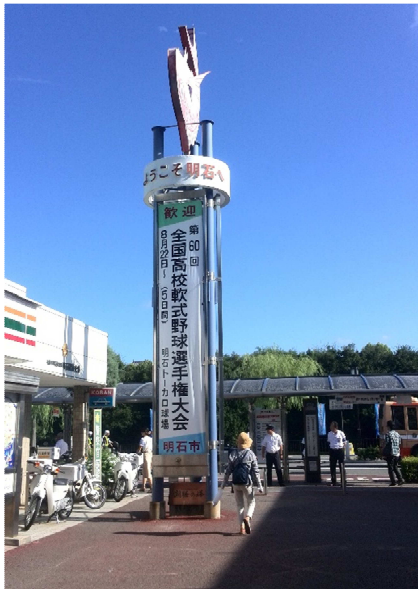
明石駅前 ここを左に行きます