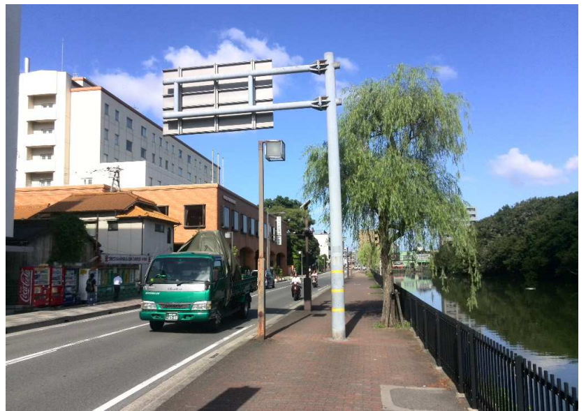
左は選手宿舎のひとつ